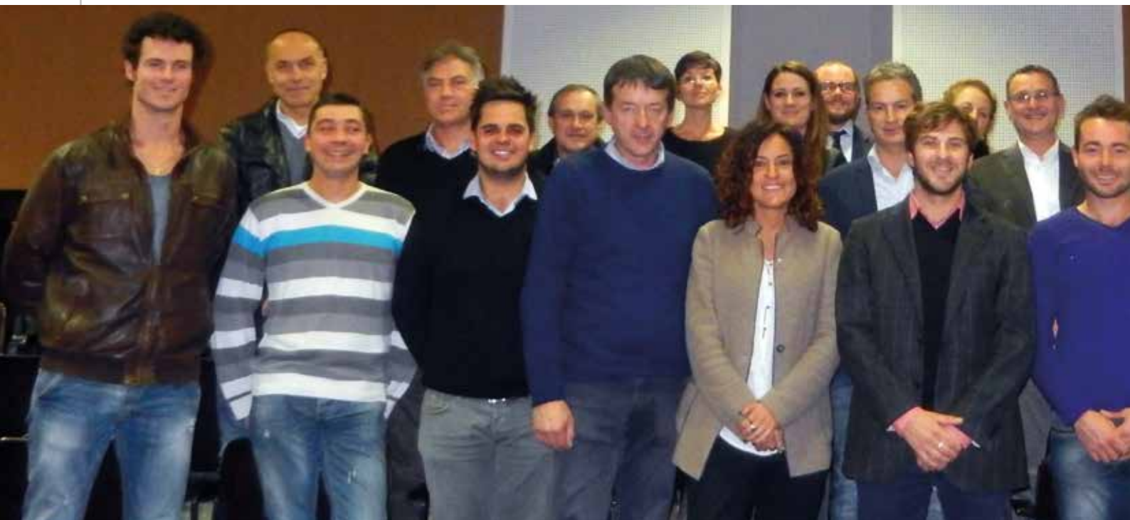
Il Consiglio comunale di Predaia