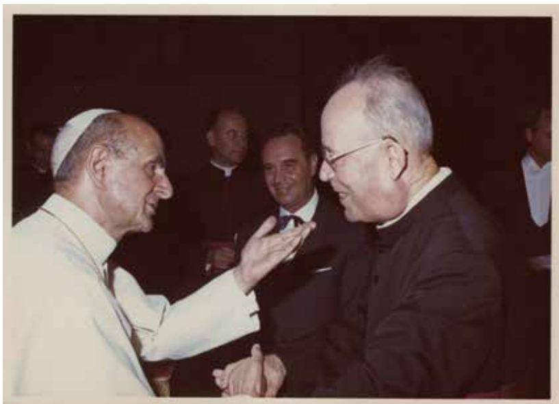
Mons. Celestino Eccher con papa Paolo VI.