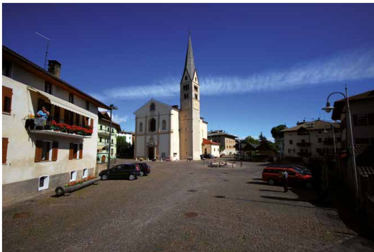
La piazza di Smarano, ieri e oggi, con la chiesa dell'Assunta.