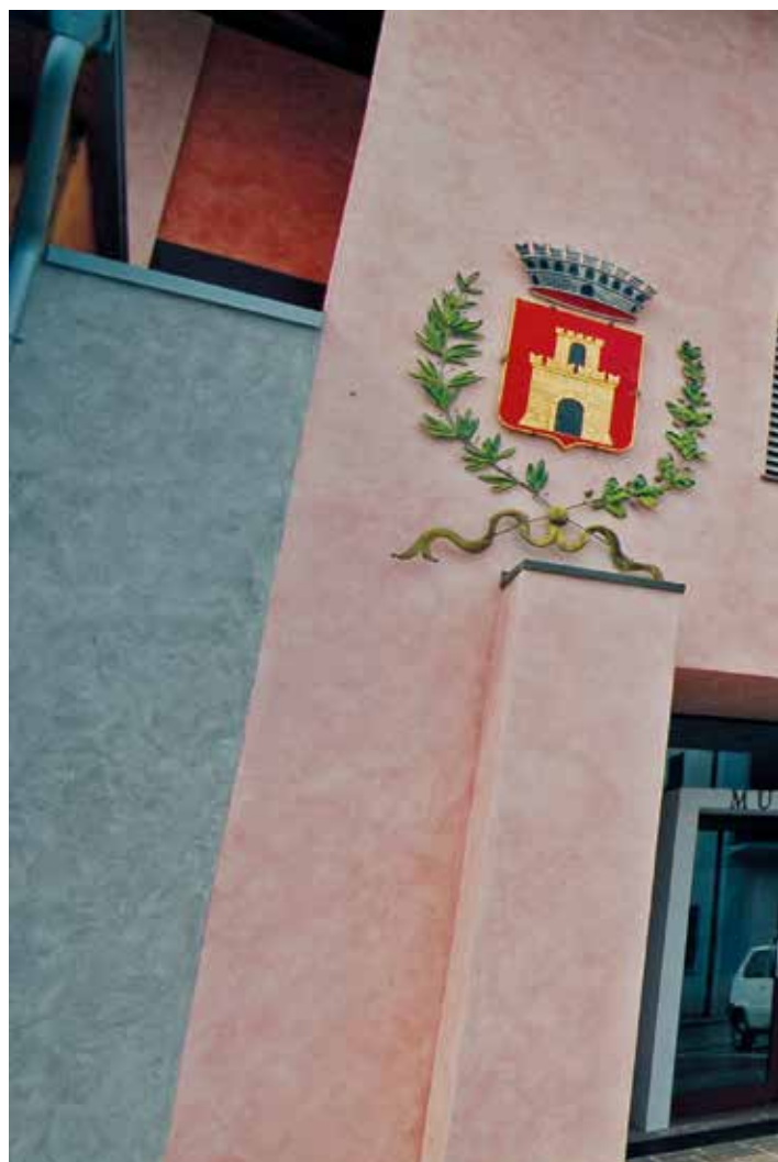
La sede comunale di Taio

abbiamo valorizzato le competenze e le conoscenze presenti, fornendo gli strumenti ed il metodo che permettesse a ciascuno di trovare le soluzioni più idonee ad un corretto svolgimento delle attività quotidiane. Parte dell'obiettivo è accompagnarle nel percorso fino a quando non saranno diventate autonome nella gestione delle nuove modalità e regole di lavoro. Insieme a loro abbiamo affrontato una prima parte di analisi, che ha posto il focus sul più importante cliente di un comune, il cittadino. In questa fase, come esempio, è stato analizzato un servizio legato all'acquedotto, dalla ricezione della richiesta da parte del cittadino all'emissione della fattura. Durante