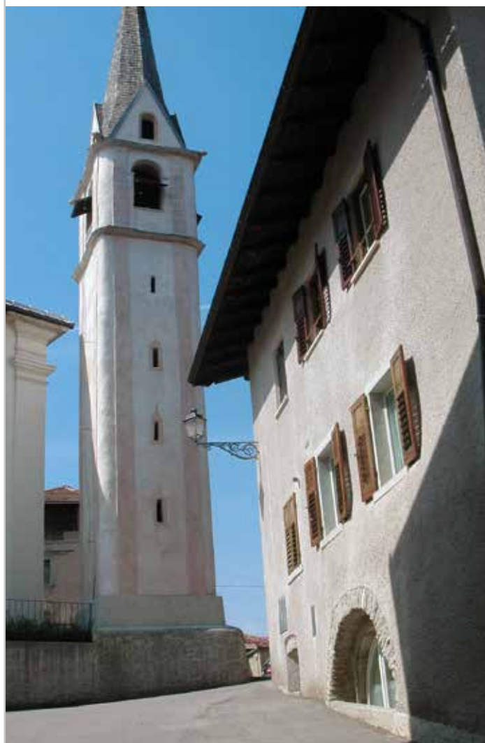
Per le vie di Tavon

LE MANIFESTAZIONI POTRANNO VARIARE OD ESSERE ANNULLATE CAUSA MALTEMPO