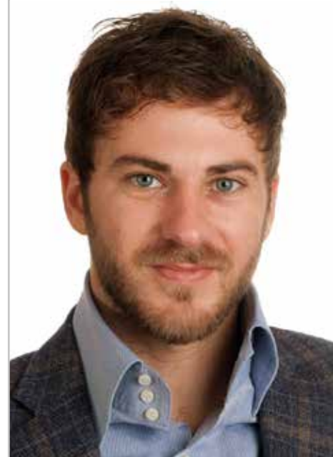
Il sindaco Paolo Forno