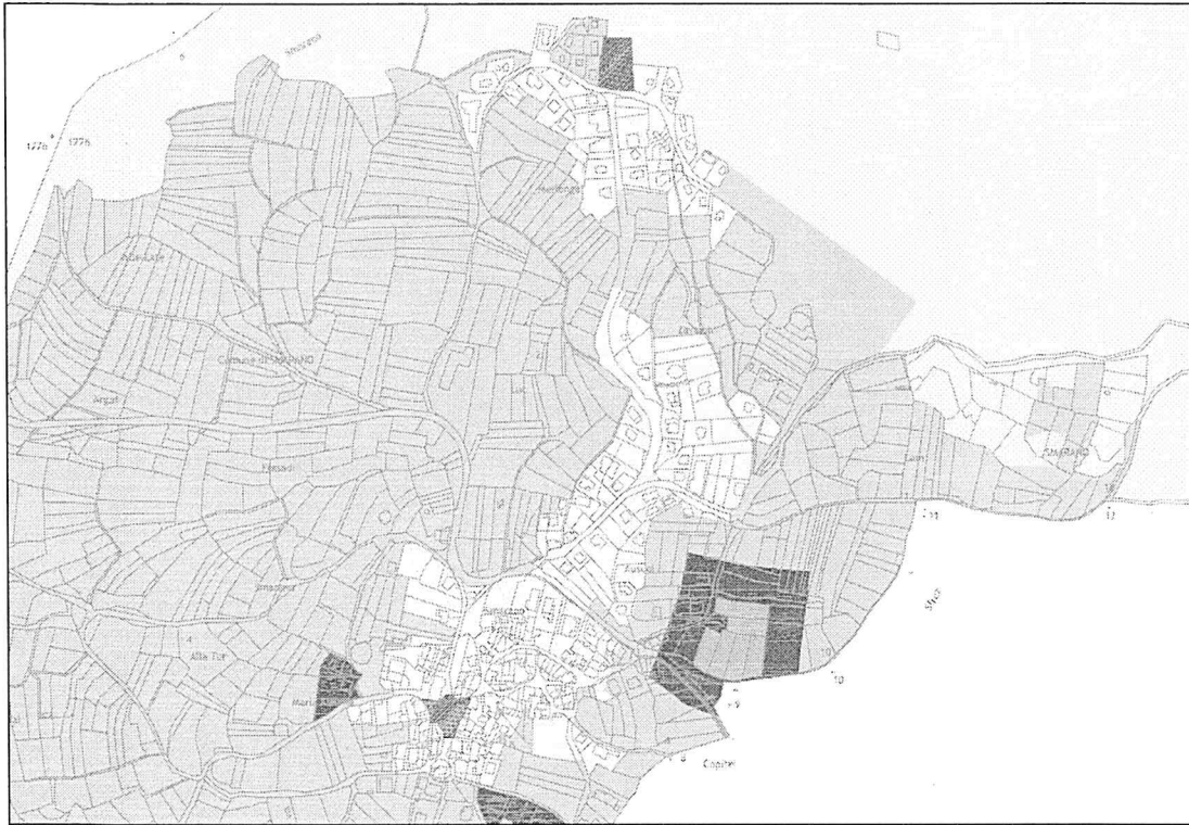
Figura 1. Il centro dell'abitato di Smarano è collocato in classe II, in considerazione della funzione prevalentemente residenziale dell'insediamento. Le aree produttive, localizzate intorno all'abitato di Smarano, costituiscono un fattore critico per il clima acustico. L'estensione delle aree residenziali inserite in classe II è influenzata e limitata dalla presenza di queste attività e delle relative fasce di transizione acustica.