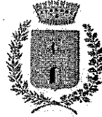
Comune di Taio