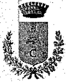
Comune di Coredo