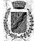
Comune di Smarano